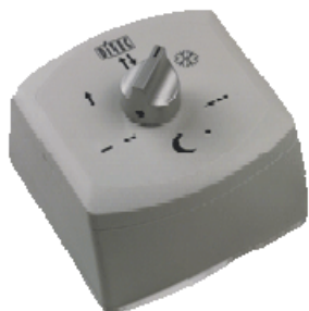
Selector de funções – Varias opções