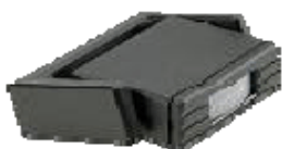
Radar infravermelho – Detecção de movimento