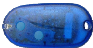
Emissor comando Bicanal – Emissor de sinal (possivel comandar dois automatismos)

A porta automática garante a circulação de pessoas com segurança é viável e funcional indicada para o comercio em geral e em espaços de grande passagem. Não esquecendo a estética e beleza são comercializados varios tipos de acabamento podendo existir só vidro de segurança não necessitando de recerco(aluminio).